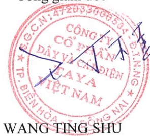
WANG TING SHU