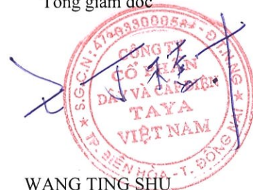
WANG TING SHU