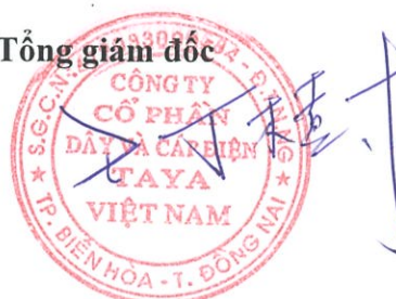
WANG TING SHU